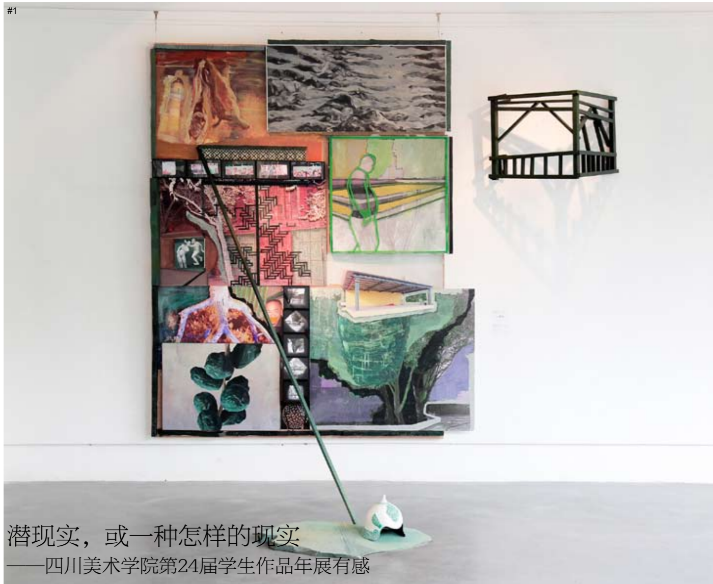
#1 潜现实，或一种怎样的现实 ——四川美术学院第24届学生作品年展有感

Sub-Reality, or What Kind of Reality Is It—Comment on the 24th Exhibition by Students from Oil Painting Department