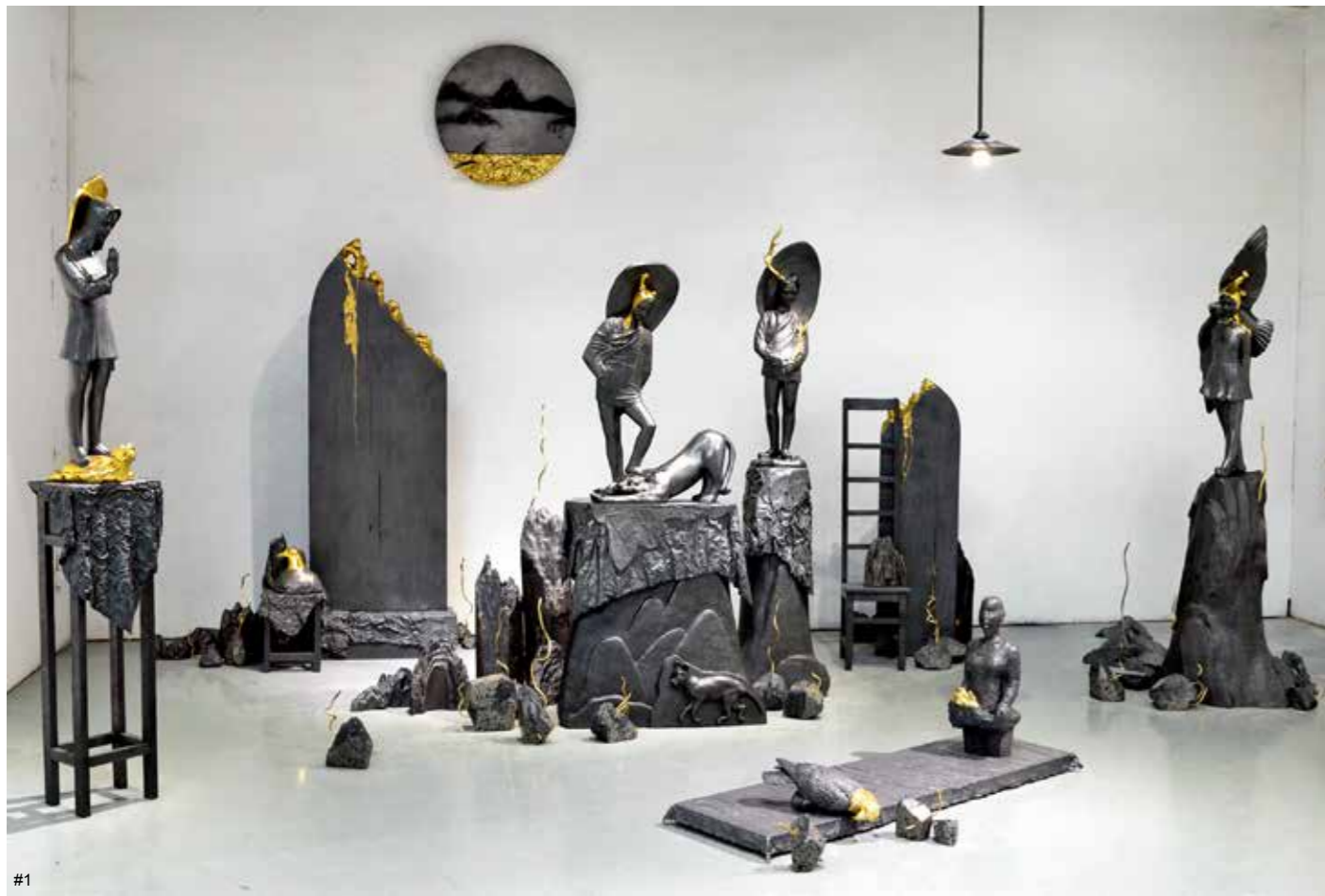
1 刘磊 造梦记系列二 铅、金箔 700cm × 500cm × 350cm 2019