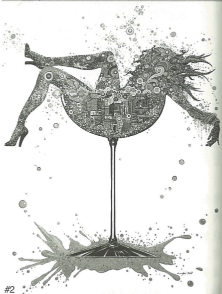
#1 中国制造 版画 刘洋 #2 受宠的粉色 油画 黄白

慧，令人叹为观止。在感叹之余，确实验证了两国文化的不同和丰富的艺术史迹。那些创造精美雕刻的无名艺术家，在中国的艺术史上名不见经传，或被称为匠人，令人不可思议，这也是令人思考的。