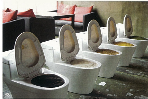
#1 身份互换系列之英国一摇滚 图片 苍鑫 #2 交流系列 图片 苍鑫 #3 剩余价值 装置作品 北水