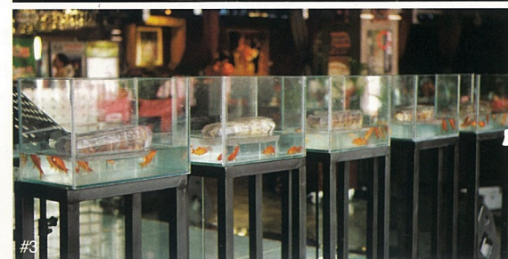
#1 无题 装置 赖玥伶 #2 无题 图片 二毛 #3 剩余价值 装置 北水